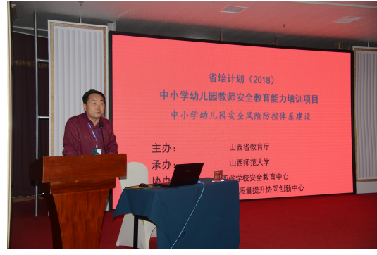
白健谷副局长畅谈培训感想