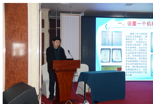
梅备战副局长分享工作经验